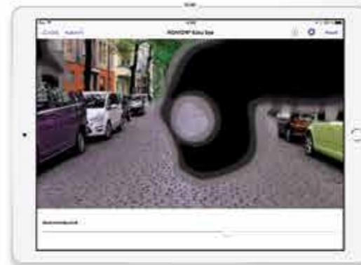
Zeitrafferaufnahmen von Gesichtsfeldausfällen bei Glaukom