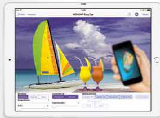
Simulation von Fehlsichtigkeiten und deren Korrektur durch Intraokularlinsen

Während Sie mit Ihrem Patienten sprechen, können Sie ihm auf dem Tablet genau zeigen, worum es geht – wie zum Beispiel: