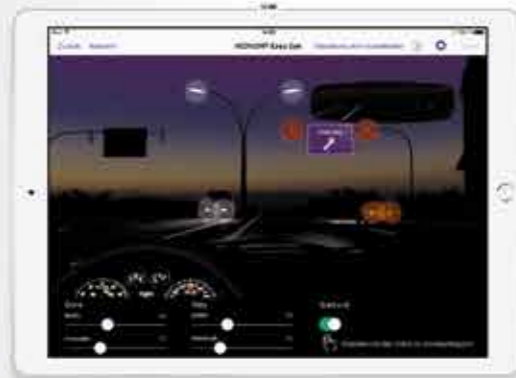
Halo und Glare Simulator zur Visualisierung möglicher Nebenwirkungen von Premiumlinsen