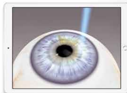
Animationen im hinteren und vorderen Augenbereich