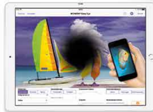
Simulation von Sehstörungen, wie Russregen oder Netzhautablösung